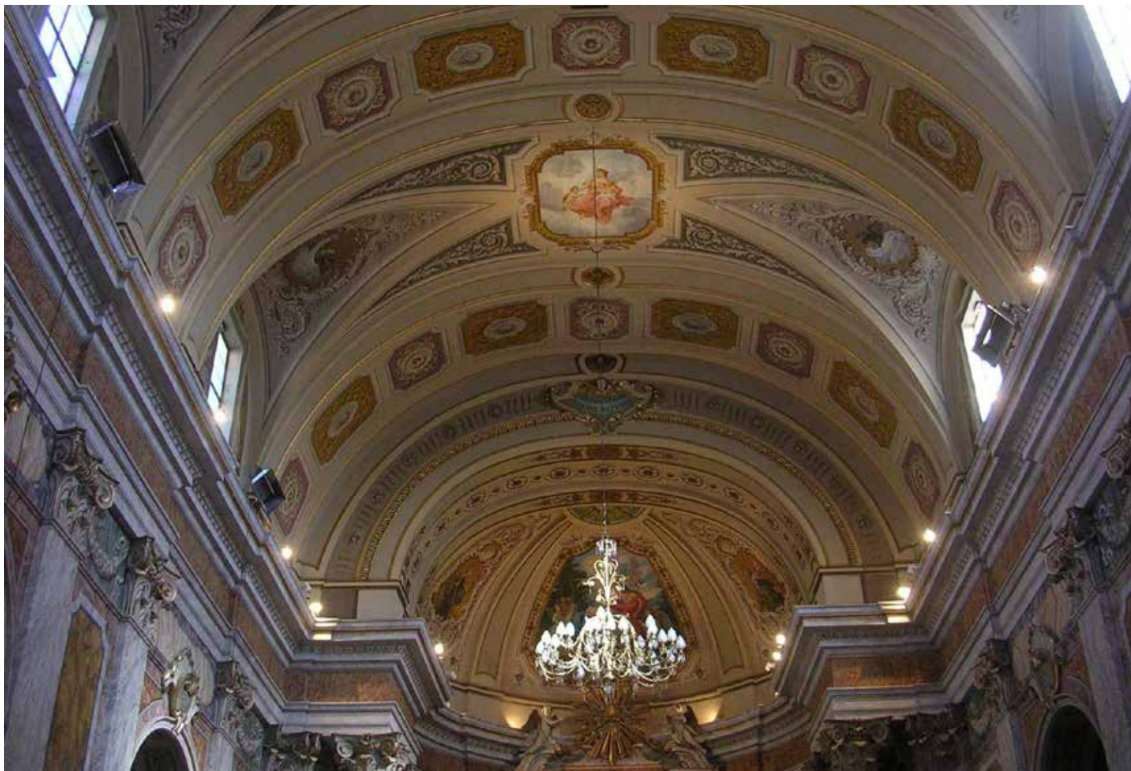
Montegiorgio, Chiesa dei SS. Giovanni Battista e Nicolò, realizzazione nuova illuminazione a led