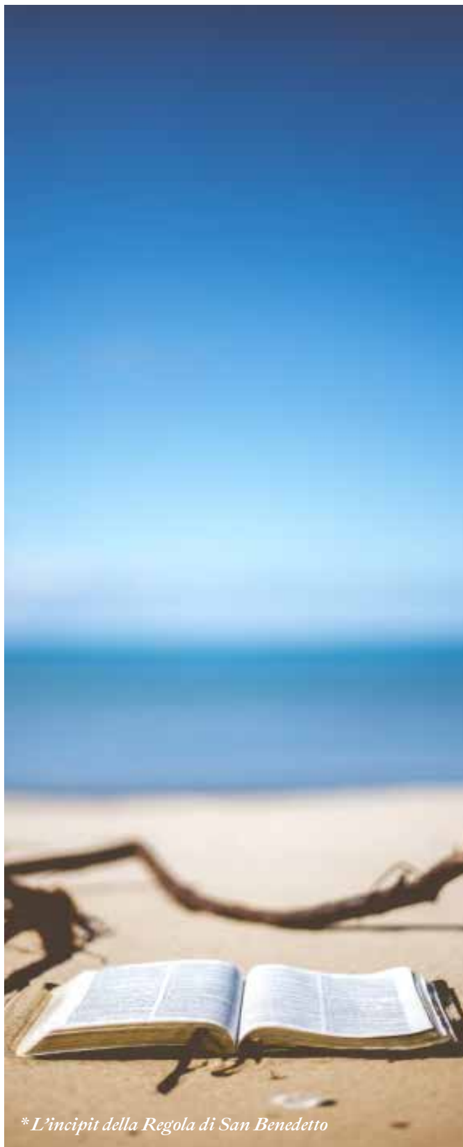
* L'incipit della Regola di San Benedetto

a cura della famiglia monastica Benedettina di Fermo