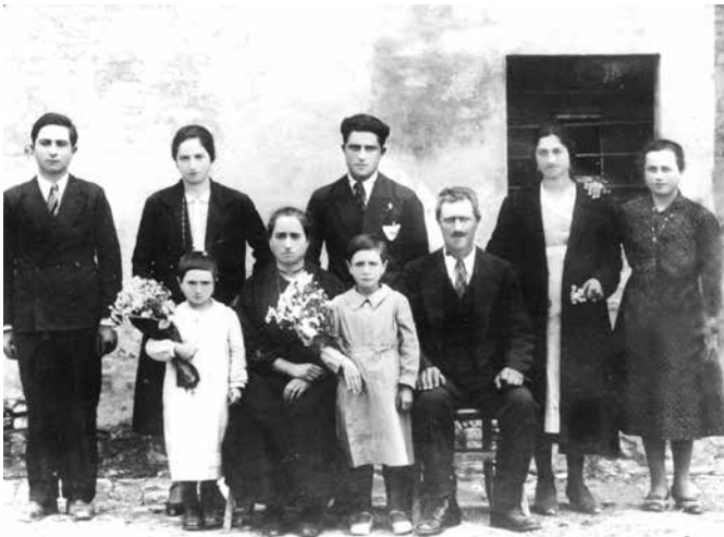
Famiglia Giustozzi, anni trenta