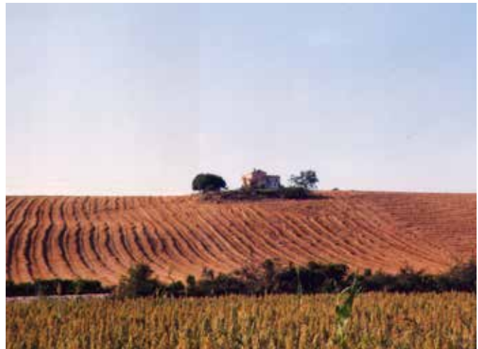
San Claudio, casa di mio nonno paterno, la ferrovia in basso

fettuoso verso i due figli, non meno della mamma. D'estate, dopo il pranzo di mezzogiorno, si butta sul letto per riposare. Dorme alla supina. Prende i due bambini sulle proprie braccia stese, uno da una parte, l'altro dall'altra. Nonostante siano passati tanti anni e i due ragazzi siano diventati grandi, sposati, con figli, uno con nipoti, ricordano ancora questo gesto carico di affetto. Il più grande dei due fratelli, rimaneva sempre con un groppo alla gola ogni volta che vedeva suo papà prendere la bicicletta per recarsi nel vicino paese per andare, così come lui diceva, all'udienza dal fattore. Era una vecchia Legnano con i freni a bacchetta.