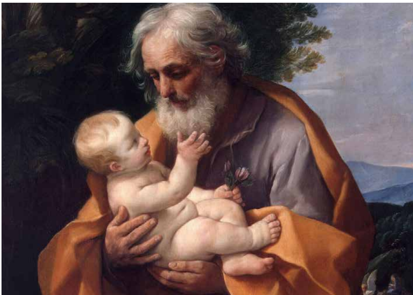
San Giuseppe con Gesù Bambino in braccio - Guido Reni

A rtisti di tutta l'arcidiocesi di Fermo, unitevi! Non è stato detto esattamente