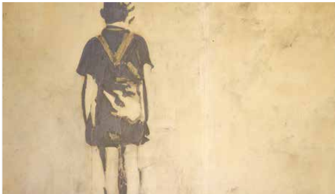
L'abbandono, le difficoltà della vita senza accanto la guida di una figura paterna

Spesso accade che la figura paterna sia sostituita da quella del nonno e ciò rientra nella sfera di quel "pensiero magico" che caratterizza la fase evolutiva di ogni figlio. È necessario considerare inoltre come quel bambino privo del padre abbia un estremo bisogno di sentirsi simile ai propri coetanei. In realtà, che accade? La teoria corrisponde sempre alla "pratica"? Il racconto che riporto è quello di un uomo che pur avendo oggi una propria famiglia, conserva nel cuore, nella sua anima, nella sua mente, la nostalgia e la ricerca del proprio