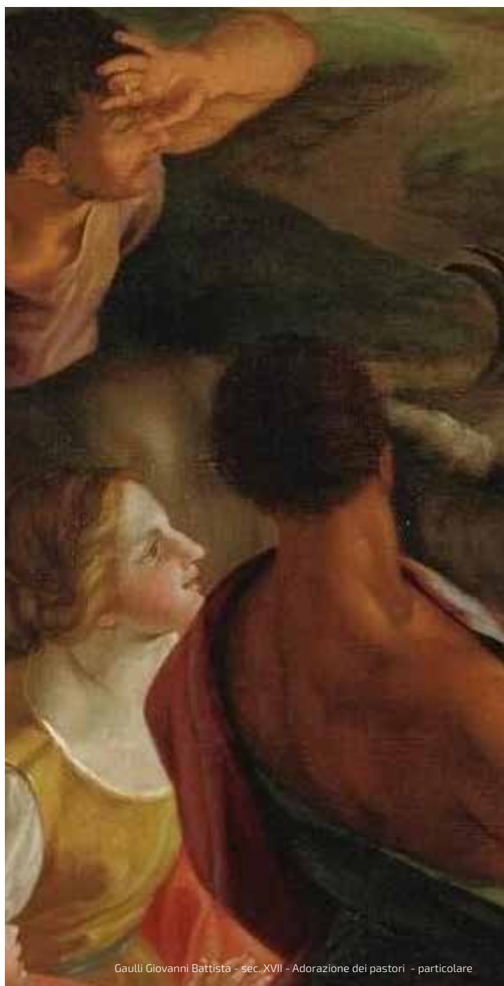
Gaulli Giovanni Battista - sec. XVII - Adorazione dei pastori - particolare