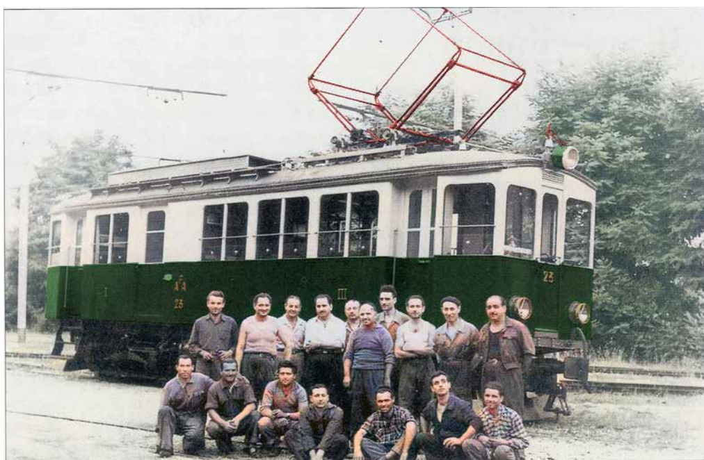
Tecnici e operai dell'AFA ritratti alla vigilia della soppressione della ferrovia. La prima corsa a trazione elettrica si effettuò il 28 maggio 1928 e l'ultima il 27 agosto 1956.

Per l'alimentazione dell'elettricità per la prima volta venne usata in Italia una sotto-