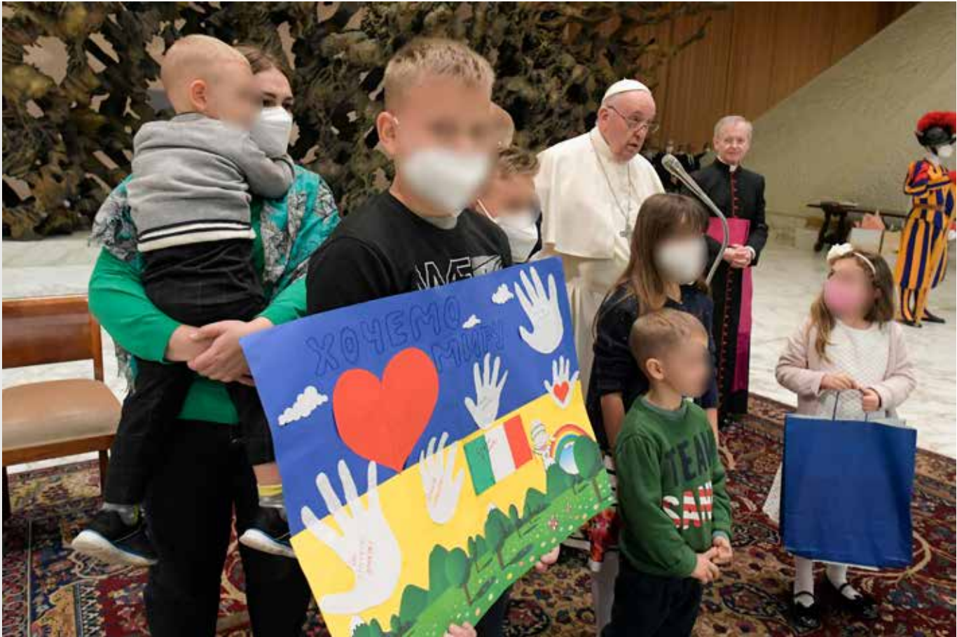
Vaticano, 6 aprile 2022: Papa Francesco tiene l'udienza generale in Aula Paolo VI. Bambini dell'Ucraina

Ho sentito in questi giorni alcuni di loro al telefono, come sono vicini al popolo di Dio. Grazie, cari fratelli, care sorelle, per questa testimonianza e per il sostegno concreto che state offrendo con coraggio a tanta gente disperata! P