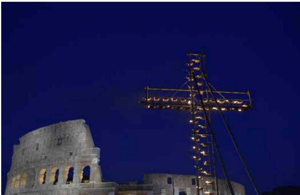
Papa Francesco presiede la Via Crucis al Colosseo

Papa Francesco: Via Crucis, una famiglia ucraina e una famiglia russa insieme nella XIII stazione. Nell'ultima una famiglia di migranti