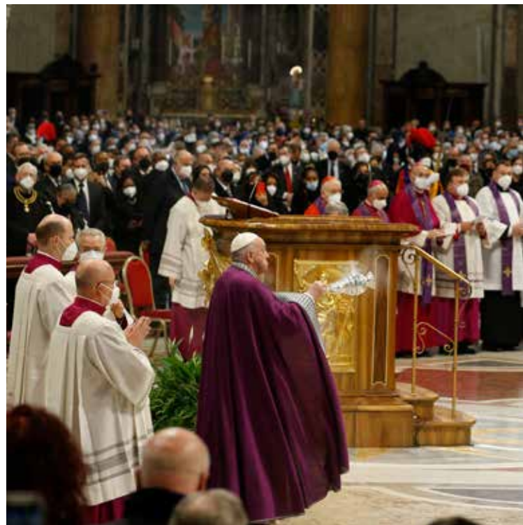
Vaticano, 25 marzo 2022: Papa Francesco alla Celebrazione della Penitenza

“In questi giorni notizie e immagini di morte continuano a entrare nelle nostre case, mentre le bombe distruggono le case di tanti nostri fratelli e sorelle ucraini inermi”, l’immagine al centro dell’omelia. “L’efferrata guerra, che si è abbattuta su tanti e fa soffrire tutti, provoca in ciascuno paura e sgomento”, l’analisi di Francesco. “Avvertiamo dentro un senso di impotenza e di inadeguatezza. Abbiamo bisogno di sentirci dire ‘non temerÈ. Ma non bastano le rassicurazioni umane, occorre la presenza di Dio, la certezza del perdono divino, il solo che cancella il male, disinnesca il rancore, restituisce la pace al cuore”. “Ritorniamo a Dio, al suo perdono”, l’esortazione del Papa. “Perché in ciò che conta non bastano le nostre forze. Noi da soli non riusciamo a risolvere le contraddizioni della storia e nemmeno quelle del nostro cuore. Abbiamo bisogno della forza sa-