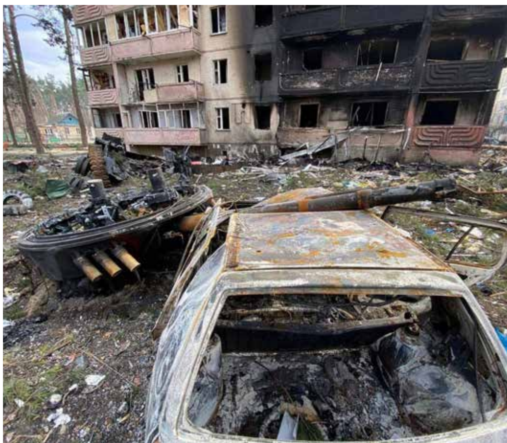
Ucraina: Kiev, quadro apocalittico a Bucha, Irpin e Hostomel

“Si può fermarla solo con il coraggio. Di guardarsi dentro. È ora di riporre le armi della paura, di far tacere le bombe dei ragionamenti, di far scendere gli aerei del controllo. E di intraprendere l’unica battaglia che vale la pena combattere, quella con le nostre resistenze. Alla vita!”