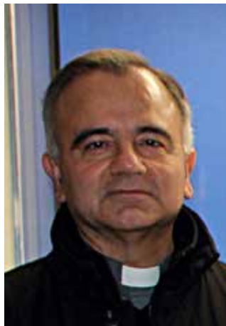
Mons. Erio Castellucci

E vento o stile? Mentre percorriamo insieme il cammino tracciato da papa Francesco – e quindi letteralmente facciamo "sinodo" – diventa sempre più evidente che l'accento è sullo stile. L'evento è importante, certo, ma deve porsi a servizio dello stile. Molti eventi e poco stile, forse è uno dei problemi delle comunità cattoliche in Italia. Già da tempo la caduta della "cristianità" reclama il passaggio dal paradigma della conservazione a quello della missione, come ripetono tutti i Papi dal Vaticano II ad oggi. La pandemia, poi, ha sparigliato le carte, costringendoci a reimpostare non solo la partita, ma il gioco stesso e le sue regole. Non basta oggi convocare le persone per gli eventi, siano essi liturgici, catechistici, caritativi o ricreativi, è necessario, sì, ma non più sufficiente