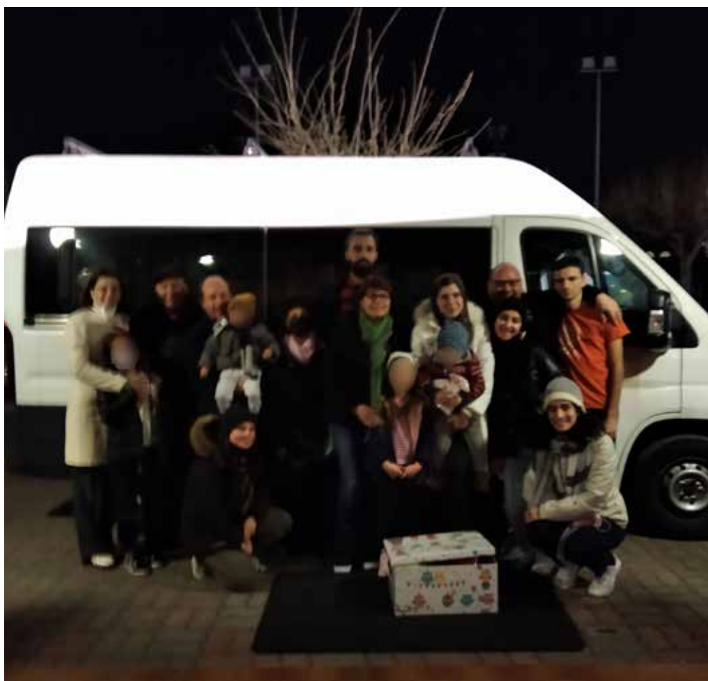
Ritorno a Civitanova Marche della delegazione con i profughi

Trascorsa la notte, i tre sono ripartiti per la Polonia alle ore 8,00 di venerdì 18 marzo e sono arrivati a Przemysl