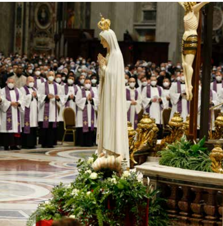
...enza e all'Atto di consacrazione al Cuore Immacolato di Maria dell'Ucraina e della Russia

...a Madre di Dio per implorare la fine della pandemia, Papa Francesco ...se a questa parte da un “massacro insensato”