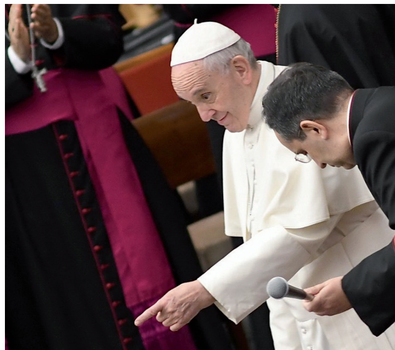
Papa Francesco: 80 anni e non sentirli

Durante i saluti nelle altre lingue, sia lo speaker spagnolo che quello portoghese gli avevano fatto esplicitamente gli auguri per il suo ottantesimo compleanno, che il Papa festeggerà sabato prossimo, 17 dicembre, con la Messa che celebrerà alle otto nella Cappella Paolina con i cardinali presenti a Roma. Poi una giornata di lavoro normale, con un fitto calendario di udienze. Intanto oggi, in Aula Paolo VI, tra i 6emila fedeli presenti si è fatta avanti una signora che gli ha regalato una torta con "80" scritto sopra. •