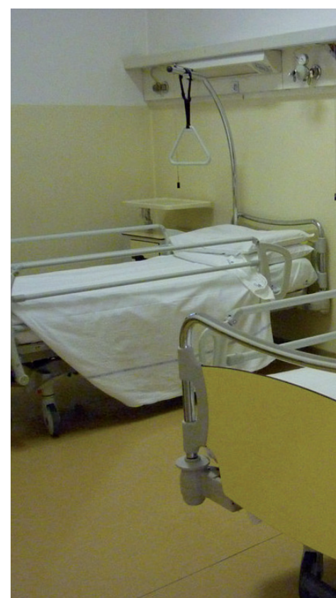
La sofferenza è uno degli elementi

Ma vi è anche l'esperienza della solitudine: nonostante la vicinanza di familiari e amici, vi è un momento in cui si è terribilmente soli. Per me questo momento è stato poco prima dell'anestesia generale, in particolare prima dell'operazione al fegato, lunga e complessa. E ho avuto paura che non mi sarei risvegliato. E allora ho dovuto fare i conti in concreto su che cosa in fondo veramente credevo. Mi sono reso conto che molte delle rappresentazioni di Dio che ci