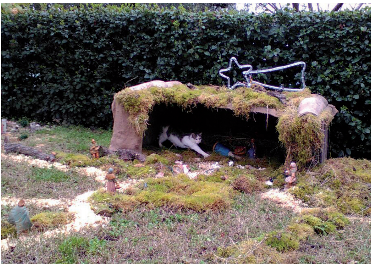
Montappone: la fede "gattolica". A casa Frontoni anche i gatti accolgono il Redentore

Dovremmo celebrare chi ci è vicino ogni giorno proprio come i re magi hanno fatto con Gesù, portando ciò che avevano di più prezioso all'essere più indifeso. Ma soprattutto dobbiamo essere quel bambino, che è sceso in una notte cupa per portare tanta luce. Ogni giorno dovremmo verificare se siamo stati la luce per qualcuno, non servono grandi gesti basta la presenza a volte. È proprio per questo che scelgo di fare il presepe perché vorrei che quella luce e quella serenità che Gesù bambino ha portato duemilasedici anni fa circa, potesse essere di nuovo sulla terra tramite le nostre azioni. Per cui quando a mezzanotte della vigilia metteremo il bambino in quella greppia non facciamolo in maniera meccanica ma riconosciamoci servi umili di Dio che con un piccolo presepe vogliono essere più vicini agli altri, e vogliono mettere realmente della luce nel mondo. •