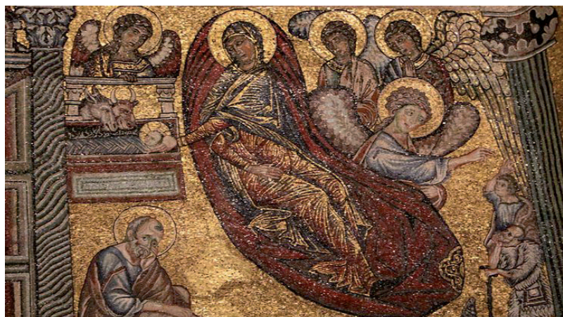
Firenze, cupola del battistero

» 15 distesa, in diagonale, la giunonica Madonna. Sopra di essa, il Bambino fasciato e posto nella mangiatoia. Da un lato, seduto e pensieroso, quasi assorto, San Giuseppe. Dall'altra parte, l'Angelo che appare ai pastori. Naturalmente, in virtù della predizione d'Isaia, a ridosso del Bambino, spuntavano i musi degli animali adoranti, mentre, a causa dei racconti apocrifi, in basso, apparivano le due levatrici intente al bagno del Neonato.