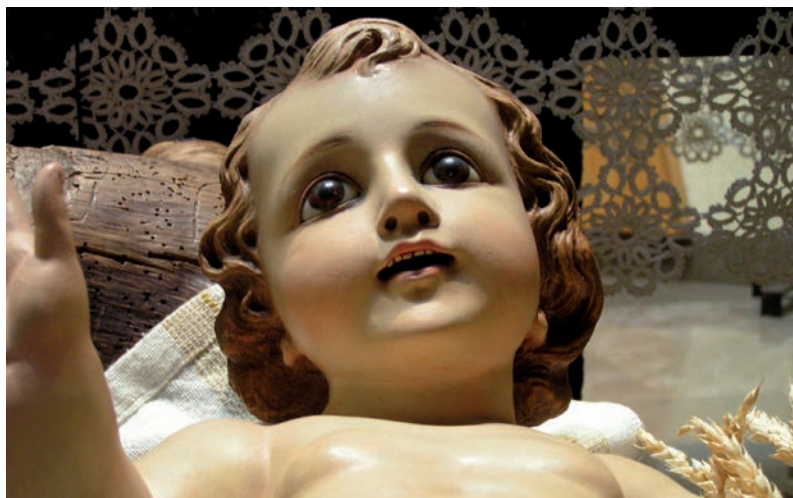
A Natale si attende di mettere la statua di Gesù bambino nella mangiatoia

Quel giorno al mare, rifletteva sui significati. Natale si stava avvicinando con tutti i suoi orpelli: luci false, acquisti falsi, vendite false, messaggi