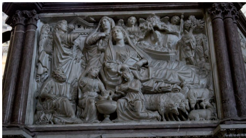
Pisa, Nicolò Pisano, pergamo