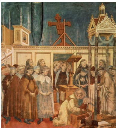
Giotto, il presepe di Greccio

Infatti, una cosa è il Presepe, ed un'altra cosa è la Natività. Una cosa è farsi «dinanzi alla stalla», e un'altra cosa è rievocare il grande evento della nascita di Gesù. La Natività consiste in una raffigurazione artistica della scena. Il Presepe, invece, consiste nella ricostruzione ambientale della medesima scena, concepita