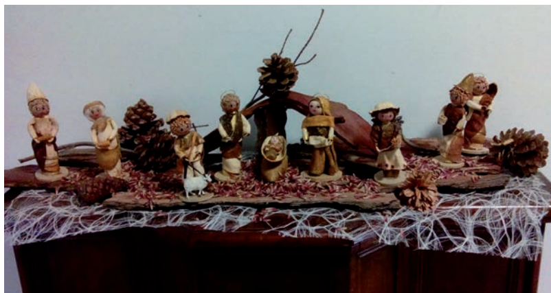
Fermo, Seminario: dalla Colombia per il Natale 2016

“Tre anni prima della sua morte, decise di celebrare vicino al paese di Greccio, il ricordo della natività del bambino Gesù, con la maggior solennità possibile, per rinfocolarne la devozione. Ma, perché ciò non venisse ascrivito a desiderio di novità, chiese ed ottenne prima il permesso del sommo Pontefice. Fece preparare una stalla, vi fece portare del fieno e fece condurre sul luogo un bove ed un asino. Si adunano i frati, accorre la popolazione; il bosco risuona di voci e quella venerabile notte diventa splendente di innumerevoli luci, solenne e sonora di laudi armoniose. L'uomo di Dio stava davanti alla mangiatoia, ricolmo di pietà, cosperso di lacrime, traboccante di gioia. Il santo sacrificio viene celebrato sopra la mangiatoia e Francesco, levita di Cristo, canta il santo Vangelo. Predica al popolo e parla della nascita del re povero e nel nominarlo, lo chiama, per tenerezza d'amore, il “ bimbo di Bethlehem ”. Un cavaliere, virtuoso e sincero, che aveva lasciato la milizia secolare e si era legato di grande familiarità all'uomo di Dio, il signor Giovanni di Greccio, affermò di aver veduto, dentro la mangiatoia, un bellissimo fanciullino addormentato, che il beato Francesco, stringendolo con ambedue le braccia, sembrava destare dal sonno”. San Bonaventura, Legenda Maior X, 7