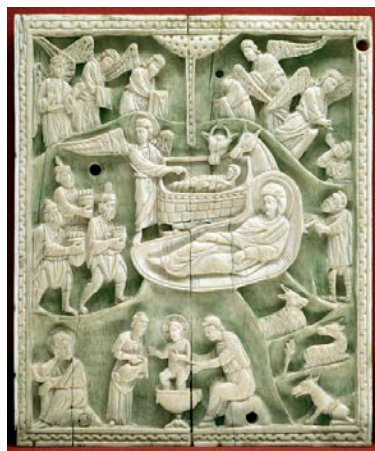
Costantinopoli, formella con natività, avorio, 1110 ca

dell'arte. I primi artisti cristiani, se vivevano nei primi secoli della Redenzione, non vivevano però nei primi secoli dell'arte. Avevano alle loro spalle la grande tradizione dell'arte greco-romana, sulla quale innestarono la loro iconografia.