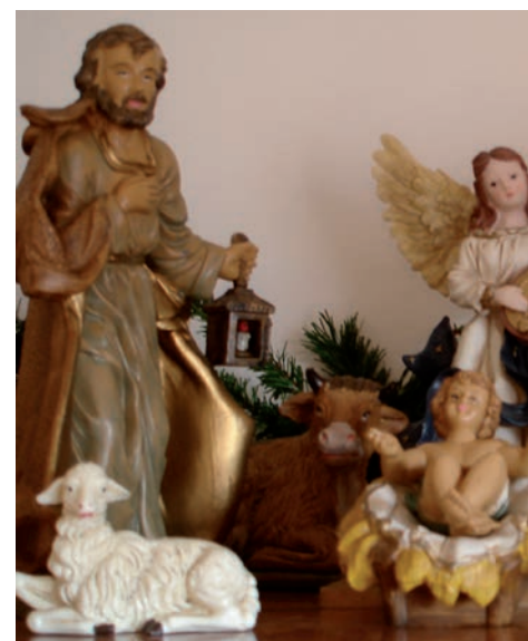
Civitanova: anche a casa del Pr

Ci si recava per far la legna, per raccogliere le ghiande, alimentazione preziosa per il maiale; non è azzardato poi sostenere che le leggende medievali attorno a boschi incantati nei quali si potevano fare strani incontri con maghi e streghe, sono arrivate fino a noi e fino a qualche decennio fa quando si vociferava di querce secolari visitate di notte dalle anime dei defunti, dalle streghe che si davano convegno, luoghi da evitare quindi e soprattutto di notte. Sono strutture mentali di lungo periodo che sono tardate a scomparire nell'im-