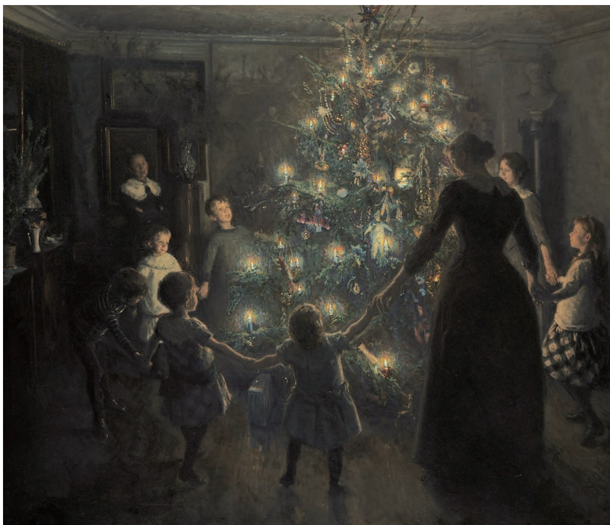
Il miracolo della Vigilia di Natale

mondo nato da pochi istanti». I giovani sorridono. I Radiohead cantano che la felicità va cercata là dove si trova. Su un tavolo, un volantino: Giotto nell'immagine, San Bernardo nelle parole: «Voi che giacetate nella polvere, svegliatevi e lodate, poiché viene il medico per i malati, il redentore per coloro che sono in schiavitù, la via per coloro che s'erano perduti, la vita per i morti... Grande è questa potenza, ma ancora più mirabile è la misericordia, poiché così volle venire Colui che si poteva accontentare di aiutarci». •