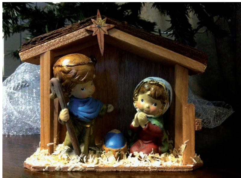
Morrovalle: i bambini accolgono un bambino

posto, mi ritornano alla mente le parole del Vangelo di Luca (2, 6-7): "Mentre si trovavano in quel luogo, si compirono per lei i giorni del parto. Diede alla luce suo figlio primogenito, lo avvolse in fasce e lo pose in una mangiatoia, perché per loro non c'era posto nell'alloggio". Tali parole sottolineano che Maria e Giuseppe sono soli, senza aiuto da parte di nessuno, nonostante lo stato di gravidanza. Non c'è posto per loro. Pertanto, sebbene la mia sia una piccola rappresentazione della natività, nella mia casa loro hanno trovato riparo, perché per prima cosa hanno trovato spazio nel mio cuore e in quello della mia famiglia. E rivederli mi ricorda di fargli spazio ogni giorno. Perciò per me non conta il luogo, la grandezza, l'erba vera o quella finta, il fabbro, il contadino o la pecorella, che