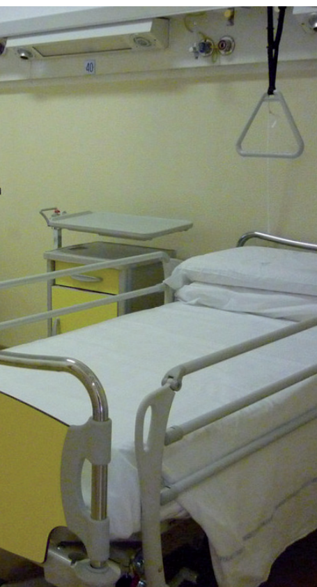
che costituiscono l'infinita complessità della vita

in alcuni valori della creazione, quali ad esempio il valore unitivo della sessualità e non solo a quello procreativo, ho creduto all' omosessualità come a una