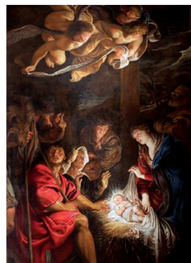
Fermo, L'adorazione dei pastori, Rubens

primo biografo, sembrava una pecora che belasse «talmente la sua bocca era ripiena, non tanto di voce, quanto di dolce affetto».