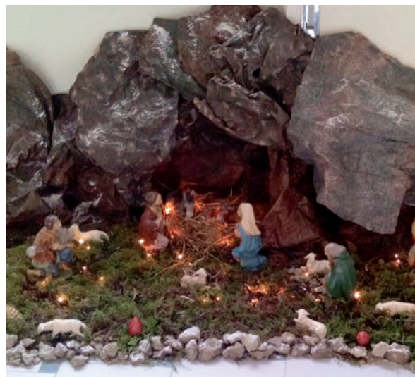
Fermo, Seminario: tante natività per tanti spazi