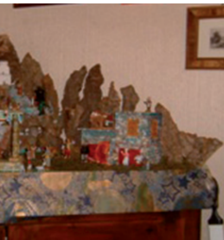
Montegiorgio: il presepe di casa Liberati

va di Vecchiotti" è stato per molti anni il fiore all'occhiello dei miei presepi nei confronti di quelli dei miei amici, tenuti rigorosamente all'oscuro della provenienza del prezioso ornamento, del quale il mio compagno di banco Vincenzo R. mi aveva messo a conoscenza. Dopo un periodo dedicato alle grandi costruzioni in Parrocchia, negli ultimi tempi, dopo varie collocazioni, il mio presepio ha assunto una forma pressoché definitiva, con la triplice scansione del classico presepe napoletano. Il mio presepio attuale, infatti, è costruito sulla base di uno scoglio originale acquistato appositamente a Napoli, in un tipico negozio nella zona di San Gregorio Armeno. Dopo i miei figli, ormai grandi ed autonomi, sono i miei nipoti che mi danno una mano per la costruzione e per il collocamento dei personaggi, che di anno in anno si trovano situati in posizioni fantasiose ed anche alquanto improbabili.