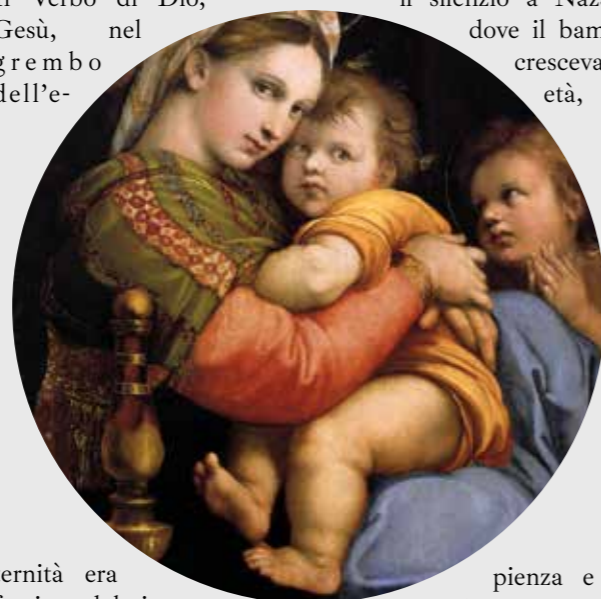
Immagine: Madonna della Seggiola - Raffaello Sanzio (1514 circa)