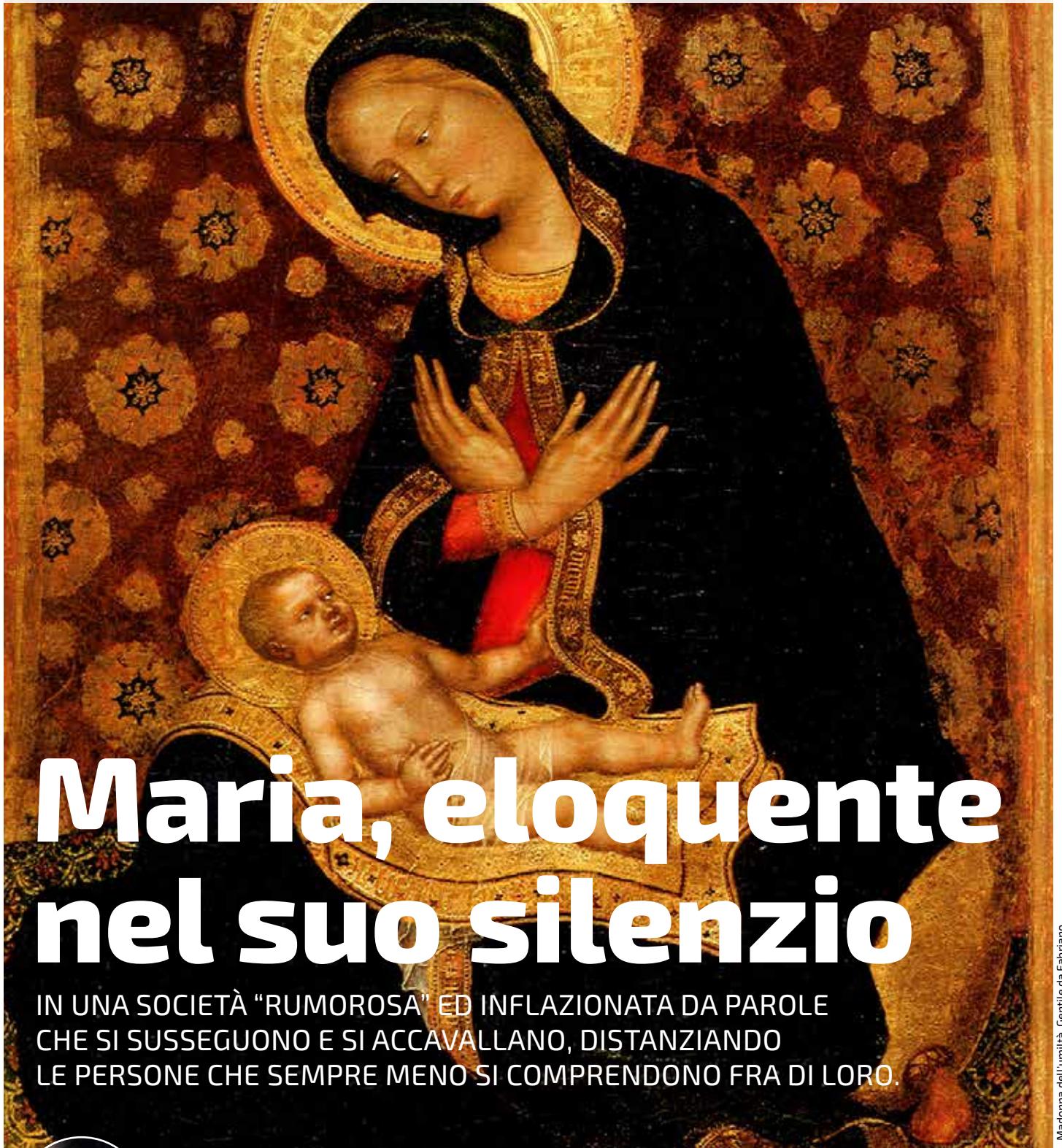
Madonna del Luminà, Gentile da Fabriano