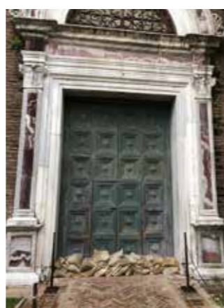
Basilica di San Vitale, tra i più famosi luoghi di culto di Ravenna

Vertice al ministero Cultura. Ieri, 21 maggio, al Ministero della cultura si è tenuto un vertice operativo dei direttori generali del dicastero, dedicato all'emergenza maltempo in