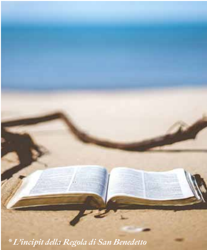
* L'incipit della Regola di San Benedetto

a cura della famiglia monastica Benedettina di Fermo