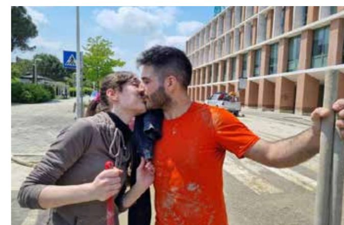
Neo sposi a spalare il fango