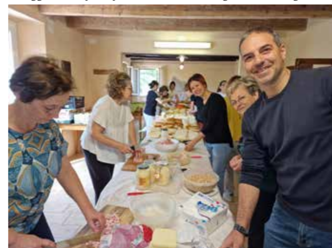
Volontari nella parrocchia di Budrio di Longiano